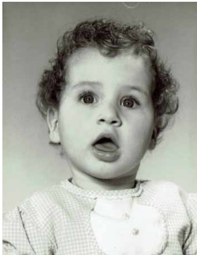
Grijze haar hier, rimpel daar.